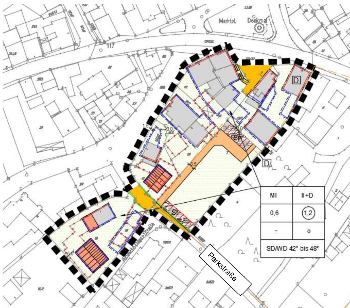
Abb. 4: Übersicht Bebauungsplan, Stand 09.12.2020, ohne Maßstab

Es handelt sich um ein zentral gelegenes Planungsgebiet im Ortskern von Adelsdorf. Der Ortskern ist charakterisiert von einer Mischung aus Wohnen, gastronomischen Betrieben und Geschäftsnutzung. Die Ansprüche an diese Flächen sind hoch.