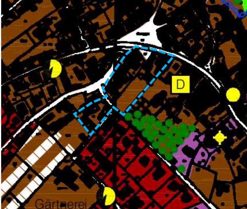
Abb. 2: Ausschnitt aus dem wirksamen Flächennutzungs- und Landschaftsplan, ohne Maßstab Planungsgebiet hellblau gestrichelt umrandet

Im rechtskräftigen Flächennutzungsplan ist dieser Bereich als „Gemischte Baufläche“ (M) ausgewiesen.